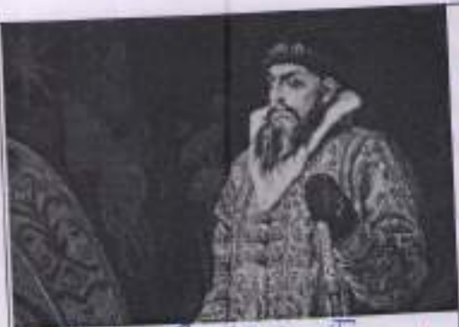
Иван Грозный IV